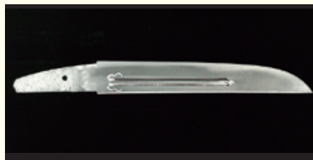
国宝 短刀 無銘 正宗 名物 庖丁正宗

武士にとって刀剣は、武器であるとともに「魂」とも呼ばれる大切な道具であり、優れた名刀は「名物」と呼ばれて尊ばれました。鎌倉時代以降の武将たちが愛蔵した名刀を紹介し、名物刀剣の歴史を振り返ります。